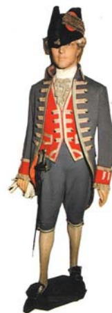
boticario militar (Corte Real, 1808)